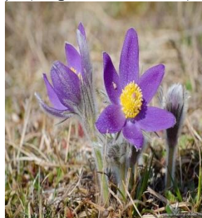
Dedițel ( Pulsatilla montana )

Rezervația prezintă importanță turistică și științifică deosebită, fapt care impune includerea acesteia în circuitele de vizitare a Munților Lotrului și a Văii Oltului în zona Brezoi – Cornetu. În rezervație sunt interzise: