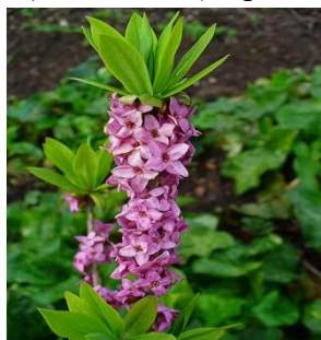
Tulichină ( Daphne mezereum )

Deosebit de reprezentativ este covorul vegetal în care apar, alături de elementele floristice specifice, specii termofile, specii endemice, la care se adaugă o faună bogată. A fost declarată în mod oficial în 1983. Flora este reprezentată de specii arboricole de fag din specia Fagus sylvatica și gorun din specia Quercus petraea . La nivelul ierburilor sunt întâlnite mai multe specii de plante rare sau endemice , printre care: garofiță ( Dianthus henteri ), sânziană din specia Galium valantoides , cimbrisor din specia Thymus comosus , dedițel ( Pulsatilla montana ), tulichină ( Daphne mezereum ), tămâiță ( Daphne cneorum ).