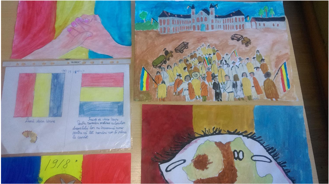
DESENE REALIZATE DE PATRICIA RĂDUCANU, GRAȚIELA DICU, RAUL DIȚA, RENATA POPESCU ȘI ANTONIA POTCOVARIU