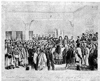
Solemnitatea deschiderii Adunării ad-hoc din Țara Românească, litografie de Carol Popp de Szathmáry

Deciziile adoptate prin tratatul de pace de la Paris (18/30 martie 1856), prevedeau intrarea Principatelor Române sub garanția colectivă a celor șapte puteri europene (Turcia, Franța, Anglia, Prusia, Austria, Rusia, Sardinia), revizuirea legilor fundamentale, alegerea