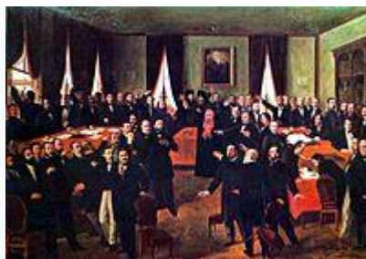
Theodor Aman: Unirea Principatelor